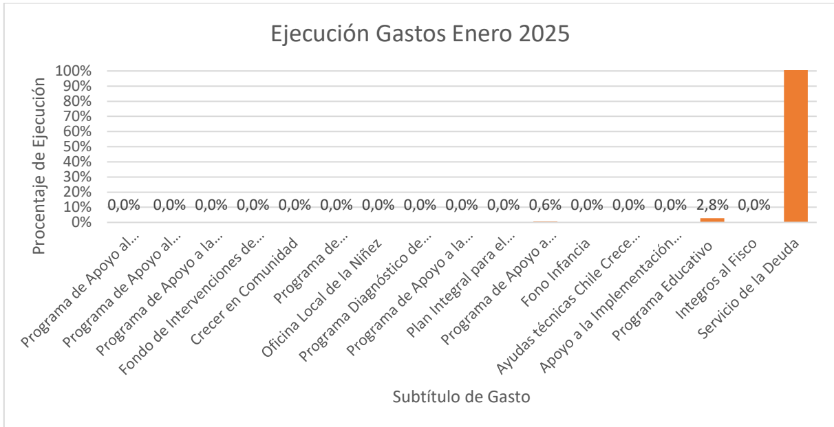
Gráfico 2: % ejecución de gastos P02 Sistema de Protección Integral a la Infancia