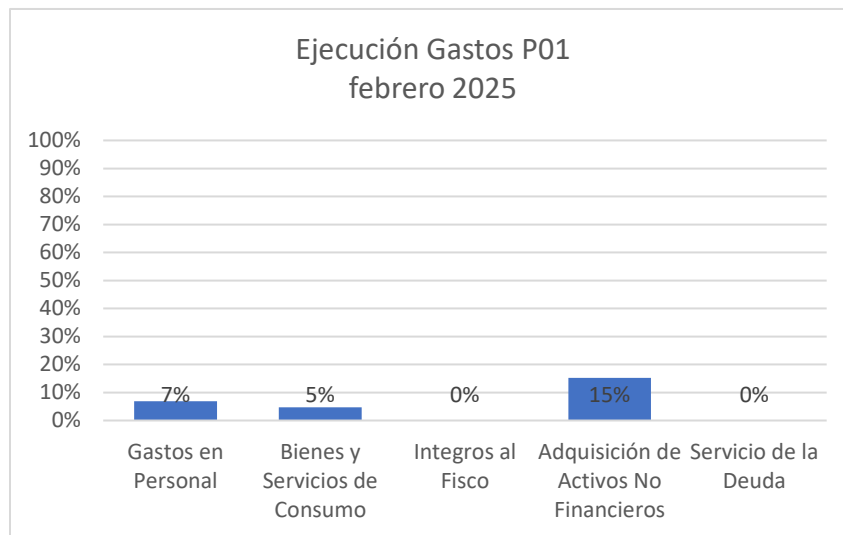
Gráfico 1: % ejecución de gastos P01 Subsecretaría de la Niñez